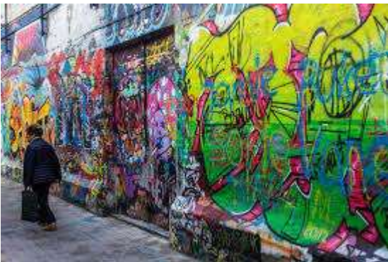
Ruelle des Graffitis