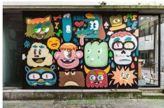
Bue The Warrior

Le Cercle Pégase ASBL existe grâce à la participation d'organiseurs bénévoles dont la responsabilité ne peut en aucun cas être mise en cause. Chacun participe aux activités à ses propres risques (voir https://www.cerclepegase.be/cerclepegase.htm#responsabilite )